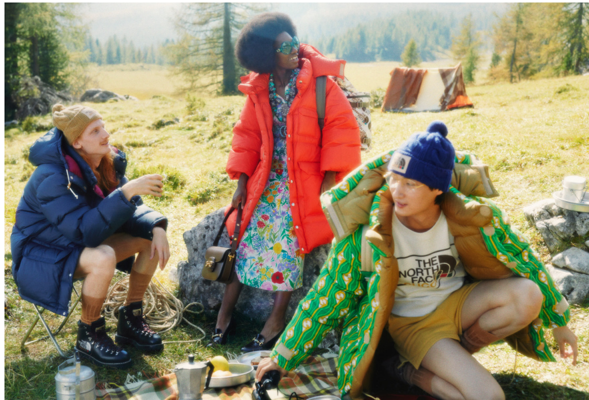
PÅ VIFT MED VÄNNER. Gucci har i vår gjort en kollektion i samarbete med amerikanska sportmodemärket The North Face. Här syns dunjackor, bomberjackor, kjolar, skjortor och jumpsuits. Ytterplaggen är inspirerade av sportmodejättens egna originalplagg från 1970-talet.

agendan. I vår lanserar de en sko med en sula delvis tillverkad i biomaterial som rörsocker och gummi utvunnet från träd. Enligt Timberland själva är skon deras mest miljövänliga produkt hittills. San Francisco-baserade Allbirds satsar på en löparsko gjord av ull behandlad med ett miljövänligt vattenavstötande lager. Kanske kan den passa även i vårt oberäknliga klimat.